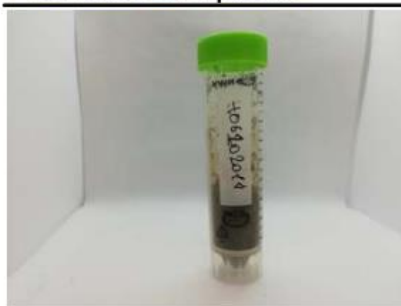
Foto del campione

Grado di umidità al momento dell'analisi - 19.07 %