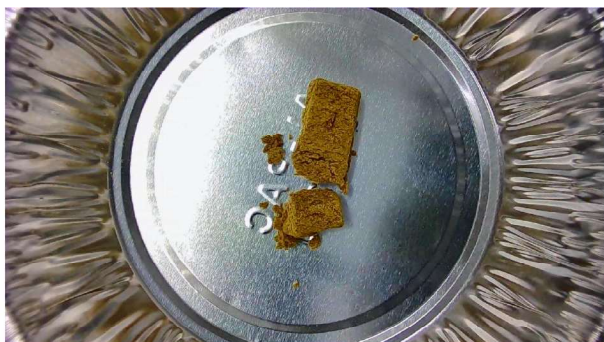
Photo de l'échantillon reçu sur 06/12/2021