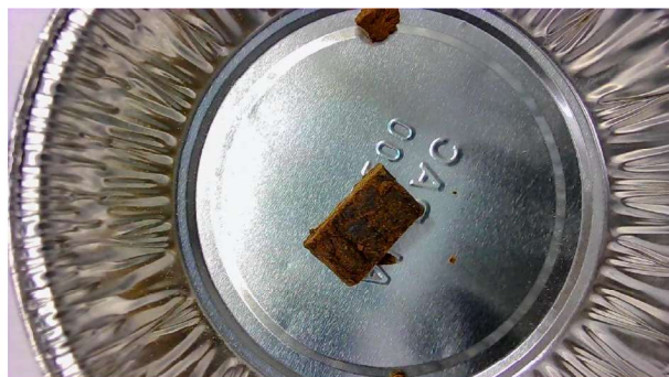
Photo de l'échantillon reçu sur 06/12/2021